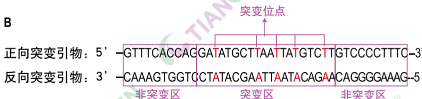
图2 TIANGEN 快速定点突变试剂盒引物设计原则