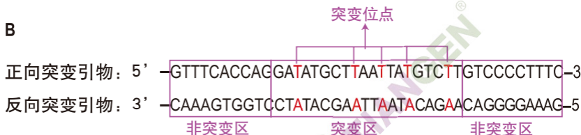
图2 TIANGEN 快速定点突变试剂盒引物设计原则